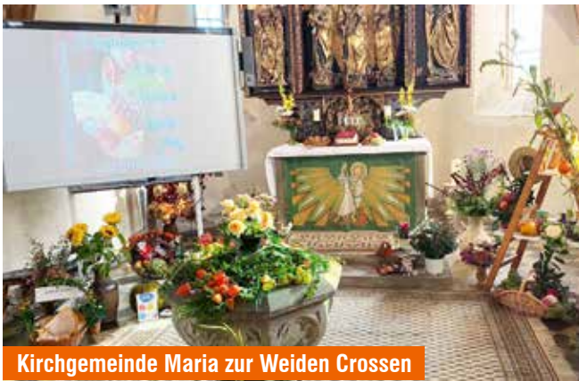
Kirchgemeinde Maria zur Weiden Crossen